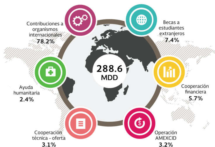
Ilustración 1: Distribución de la Cooperación Internacional para el Desarrollo otorgada por México en 2014

Finalmente, mediante la plataforma RENCID, se dio seguimiento al proceso de actualización del Catálogo de Capacidades Mexicanas, cuyo objetivo es promover las prácticas y políticas públicas de México, que constituyen la base de la oferta de cooperación técnica y científica del país. Se prevé que al finalizar el 2016, esté disponible la nueva versión de este Catálogo de Capacidades.