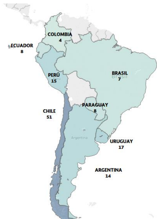
Mapa 2: Número de proyectos por país en Sudamérica

En el esquema bilateral : 52% se ejecutan en Sudamérica, 29% en Centroamérica y el 18% en el Caribe.