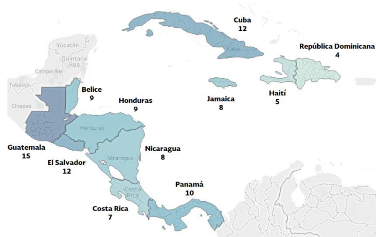
Mapa 1: Número de proyectos por país en Centroamérica y el Caribe

Para las acciones de cooperación triangular , México se ha establecido alianzas con diversos socios estratégicos para crear sinergias con otros países oferentes de cooperación internacional con la finalidad de ampliar el impacto de las iniciativas.